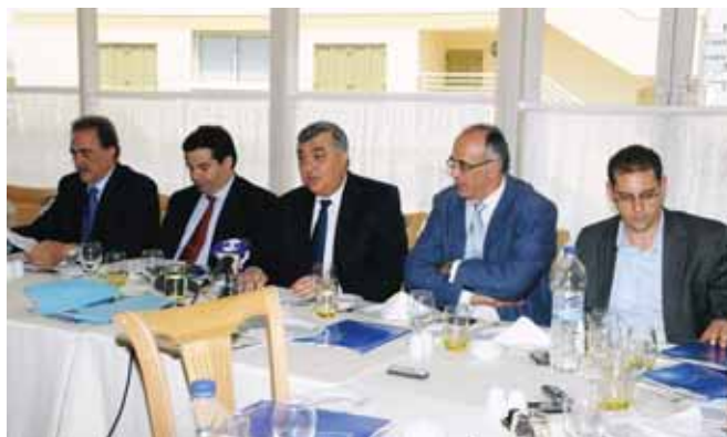
Η ηγεσία του ΧΑΚ παρουσιάζει στα ΜΜΕ τα σχέδια της για το μέλλον