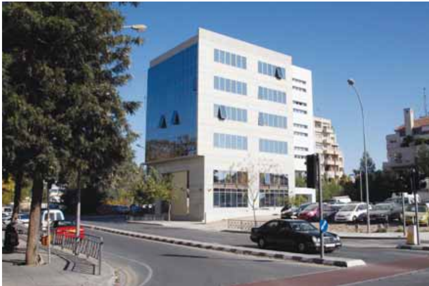
Το νέο ιδιόκτητο κτίριο του ΧΑΚ το οποίο βρίσκεται στο κέντρο της Λευκωσίας