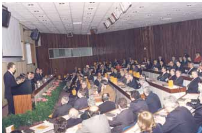
Ενημέρωση για το έργο και τις εργασίες του ΧΑΚ