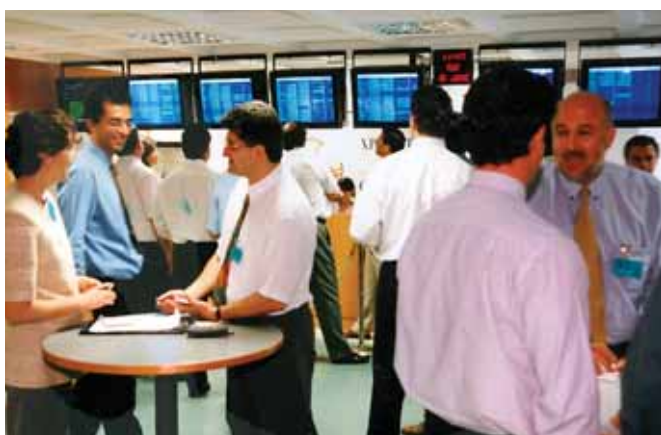
Συντελεστές της αγοράς σε ώρα χρηματιστηριακής συνάντησης