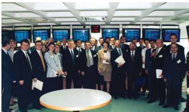
Συνέδριο Ομοσπονδίας Ευρωπαϊκών Χρηματιστηρίων στην Κύπρο το 1998