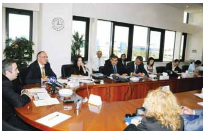
Το ΧΑΚ ενημερώνει τους δημοσιογράφους για δημιουργία Νέου Δείκτη με το ΧΑ καθώς και για άλλα νέα προϊόντα

ανοίγματος λογαριασμών Κεντρικού Μητρώου, όπου πλέον αυτό γίνεται μέσω των νέων ηλεκτρονικών συστημάτων του Οργανισμού από τους χειριστές (Μέλη και Θεματοφύλακες) εξ' αποστάσεως (από τα γραφεία τους). Συγκεκριμένα 12 συνολικά εξ' αποστάσεως Μέλη (remote members) είναι εγγεγραμμένα με το ΧΑΚ.