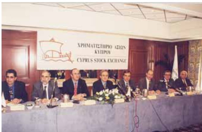
Το πρώτο Συμβούλιο του ΧΑΚ το 1996