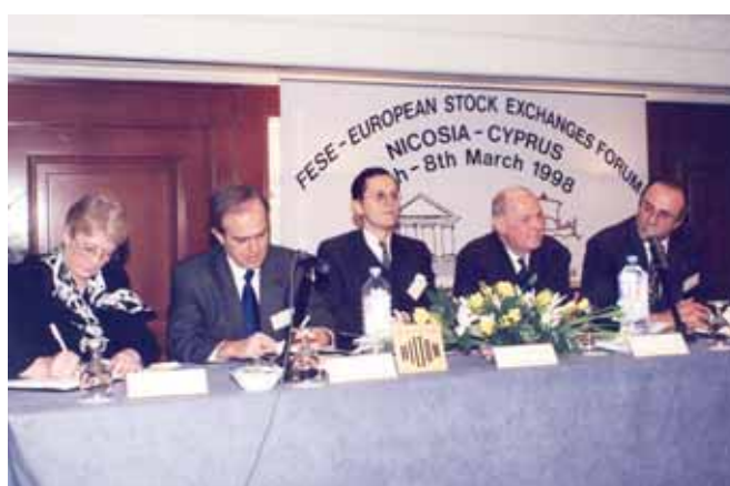
Σύνοδος των Ευρωπαϊκών Χρηματιστηρίων στην Κύπρο το 1998