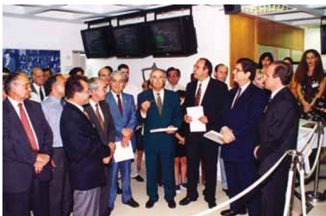
Ιστορική στιγμή από τα εγκαίνια της νέας αίθουσας συναλλαγών που απέκτησε το ΧΑΚ το 1996